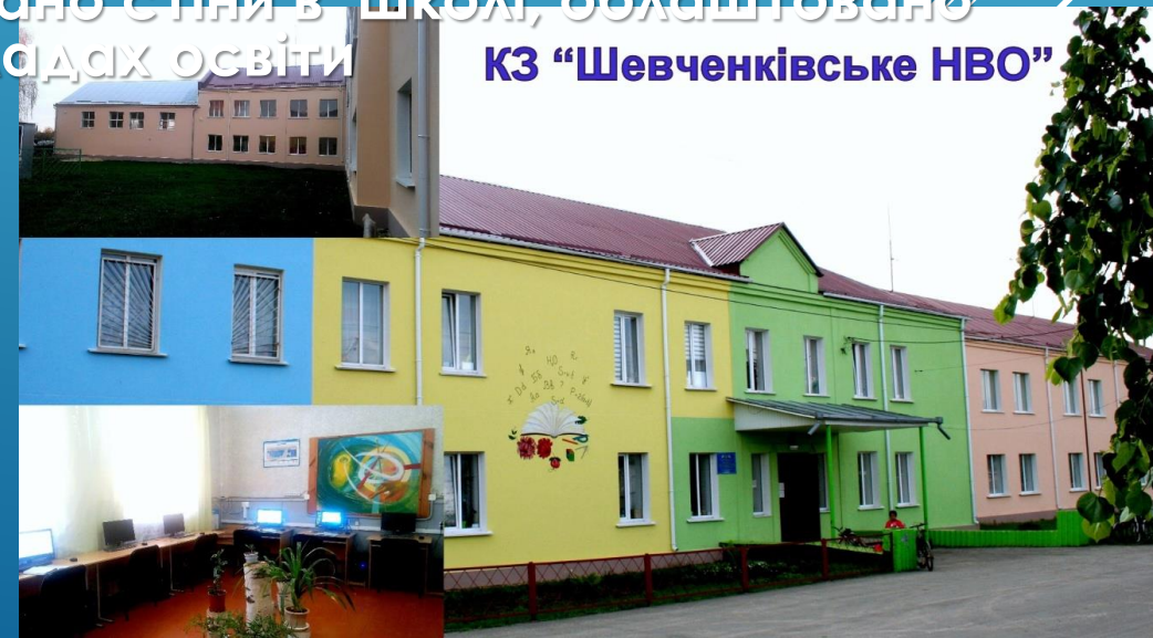
КЗ «Шевченківське НВО»